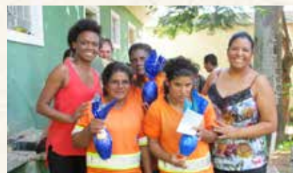
Unidade Cidade Nova